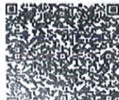
生俊卿年检二维码

本证书经检验合格, 继续有效一年。 This certificate is valid for another year after this renewal.